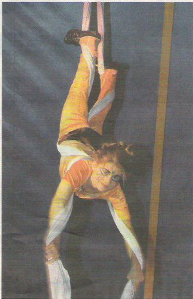
Zirkus macht Spass: Kopfüber lächelt die Artistin ins Publikum.