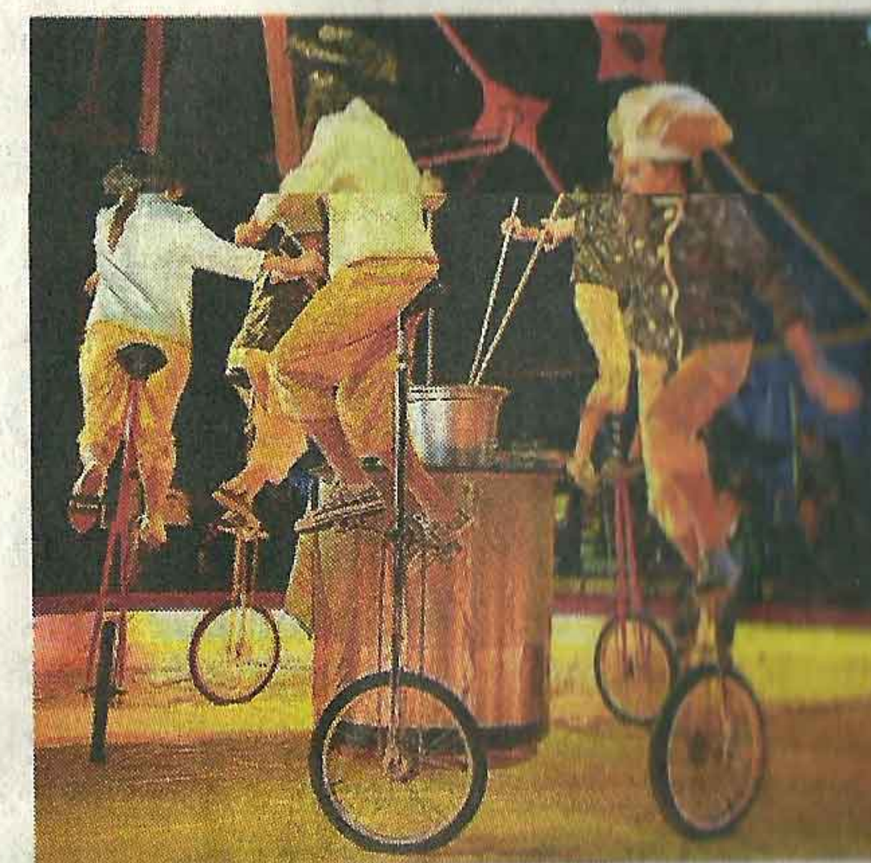
Coq au Vin auf Einrädern.