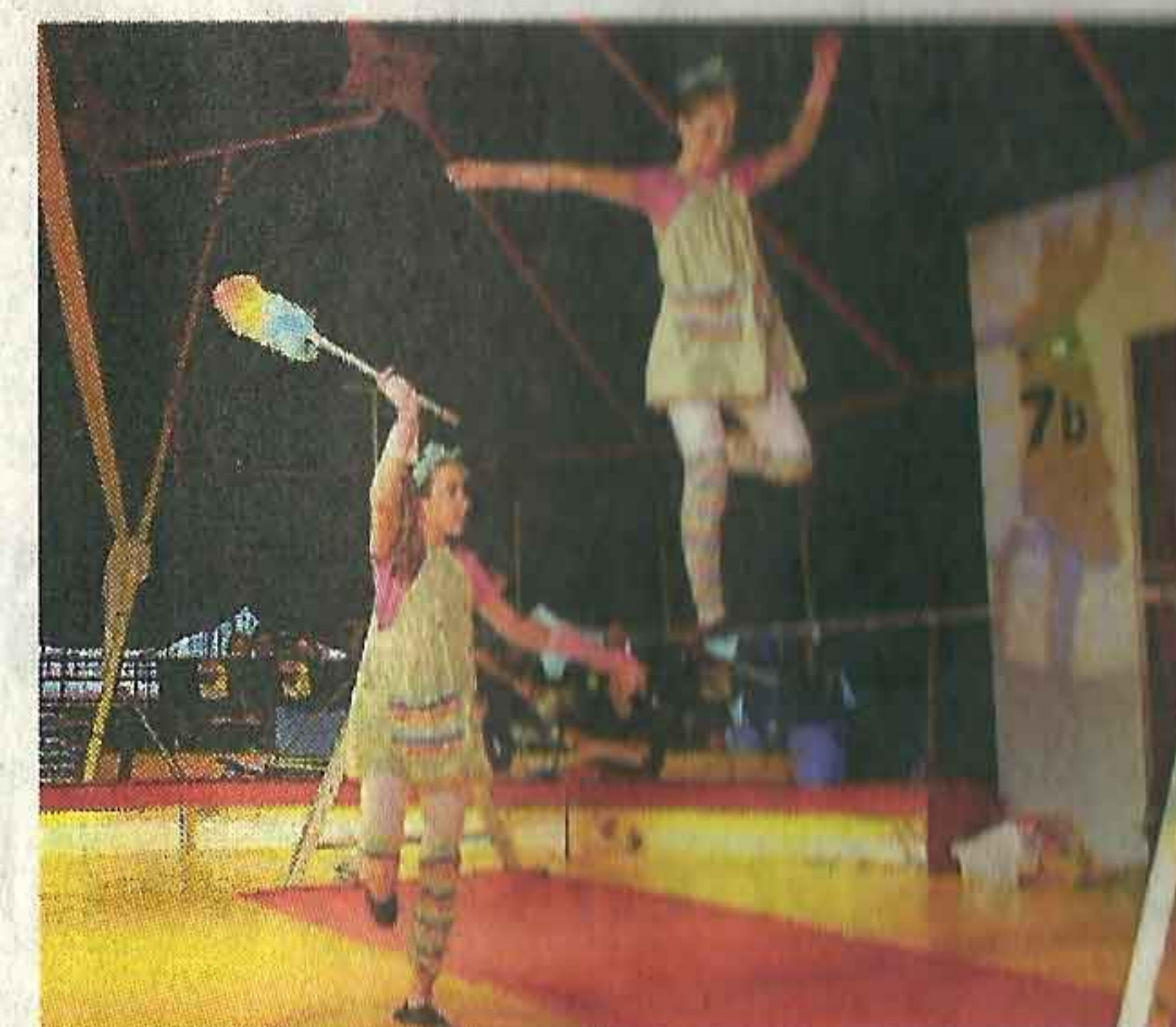
Die erste Nummer auf dem Seil.