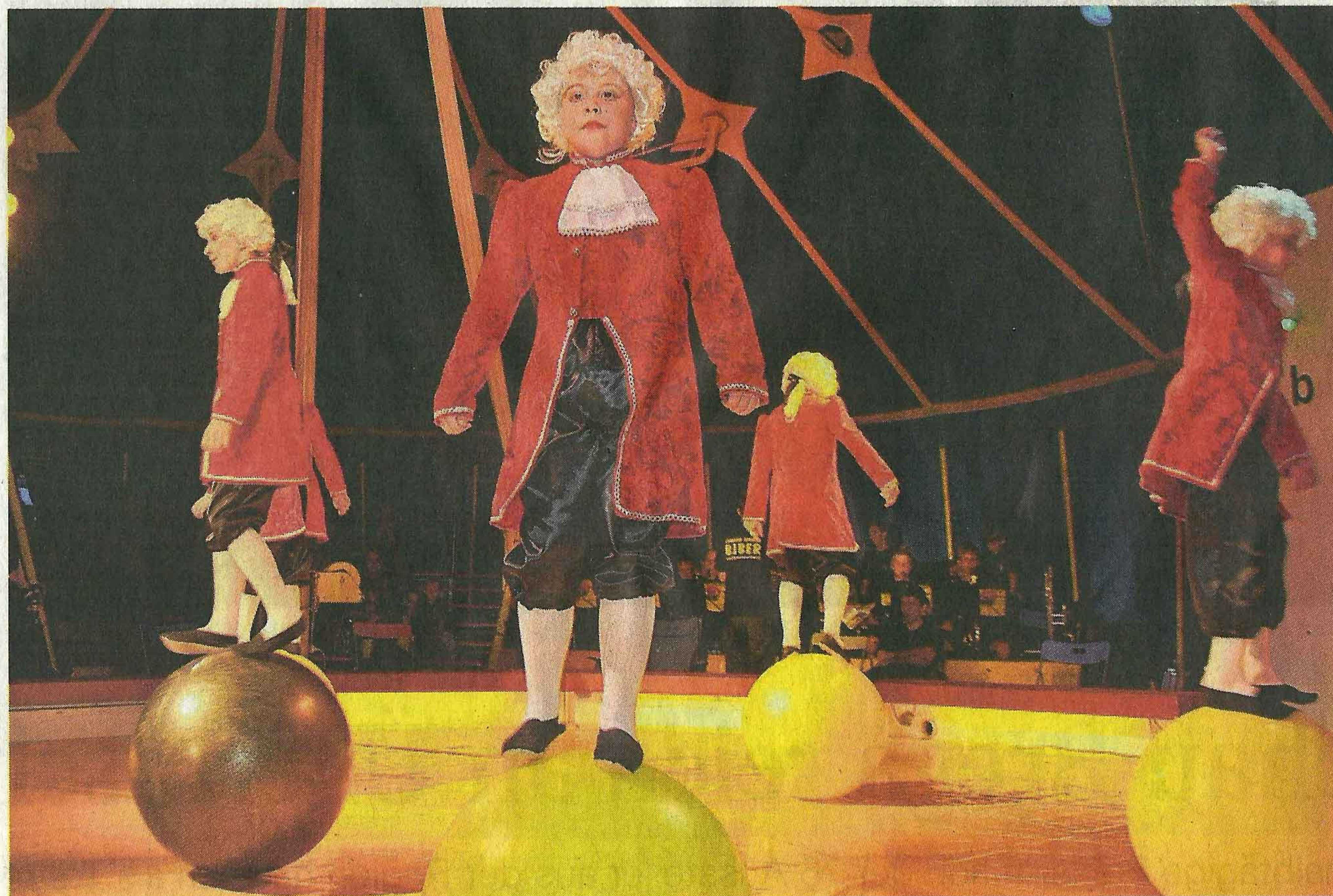
Die Biber-Interpretation von Mozartkugeln: Kleine Mozarts beim Kugellauf.

Der Jugend Circus Biber begeht zwar schon seine 27. Saison, aber