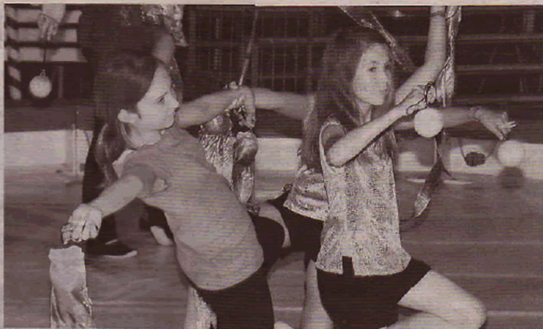
Man sieht: Der künstlerische Ausdruck sitzt.