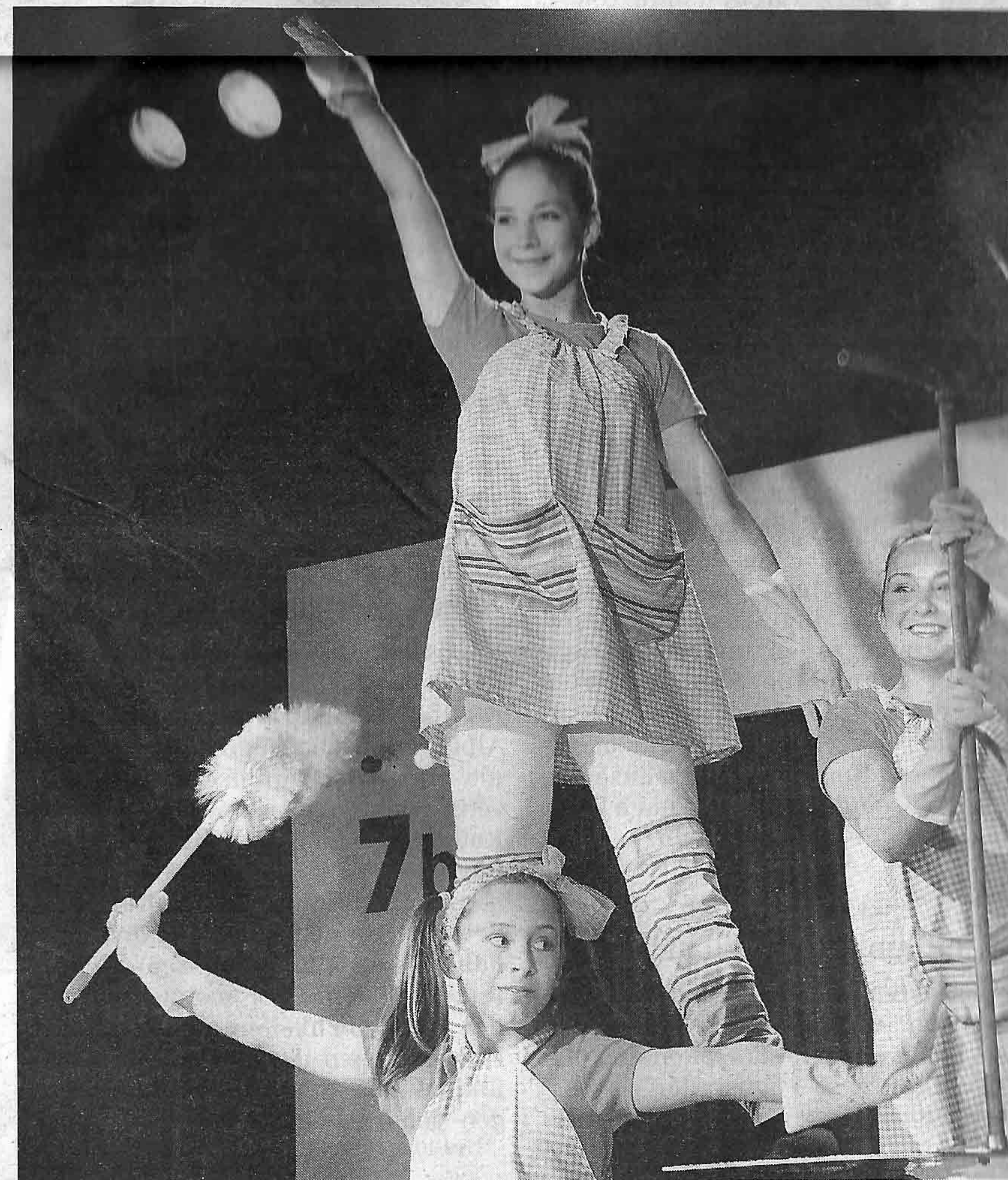
Die Seiltänzerinnen sorgten für einen sauberen Beginn der Vorstellung.

Das Publikum zeigte sich nach der Premiere begeistert. «Ich konnte mir nicht vorstellen, dass man so professionell mit Kindern arbeiten kann. Am besten haben mir die Mozartkugeln gefallen. Auch die Nummer mit